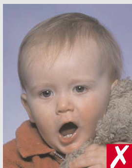
boca aberta e brinquedo próximo à face