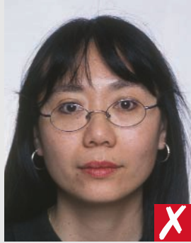
armações cobrindo os olhos