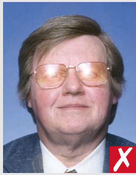
reflexo de flash nas lentes