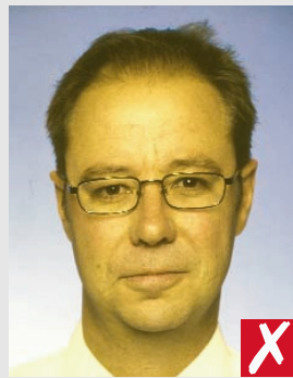
tom de pele não natural