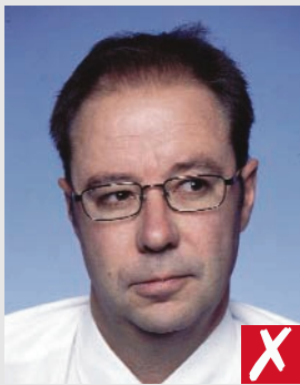
olhando p/ o lado